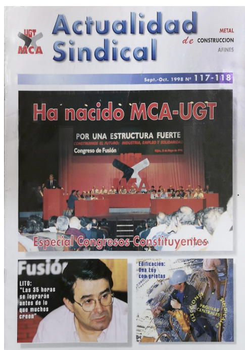
Figura 3. Portada del primer número publicado de Actualidad Sindical en septiembre de 1998